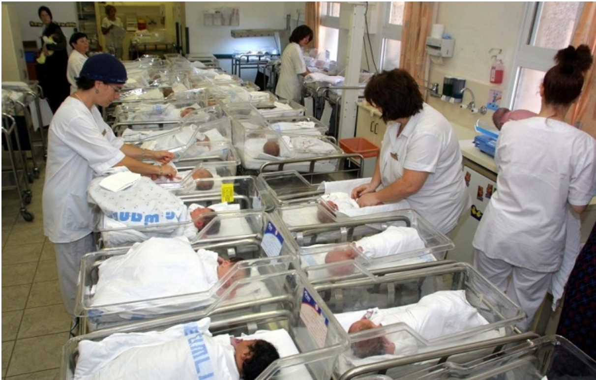
Современное родильное отделение «Бикур холим», Иерусалим

Существующая тенденция четко указывает на то, что арабское население является «стареющим обществом», причем, стареет оно почти в 4 раза быстрее, чем еврейское. И это не удивительно, поскольку после арабского демографического взрыва (1950 — 1964 гг.) арабские беби-бумеры вступают сегодня в пенсионный возраст. Соответственно, это приводит к волне естественной смертности, значительно более высокой, чем пару десятилетий назад.