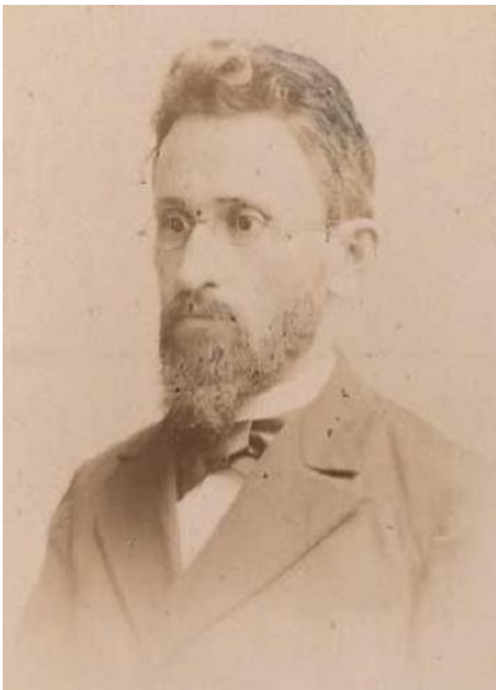
Шимон Дубнов, конец XIX века