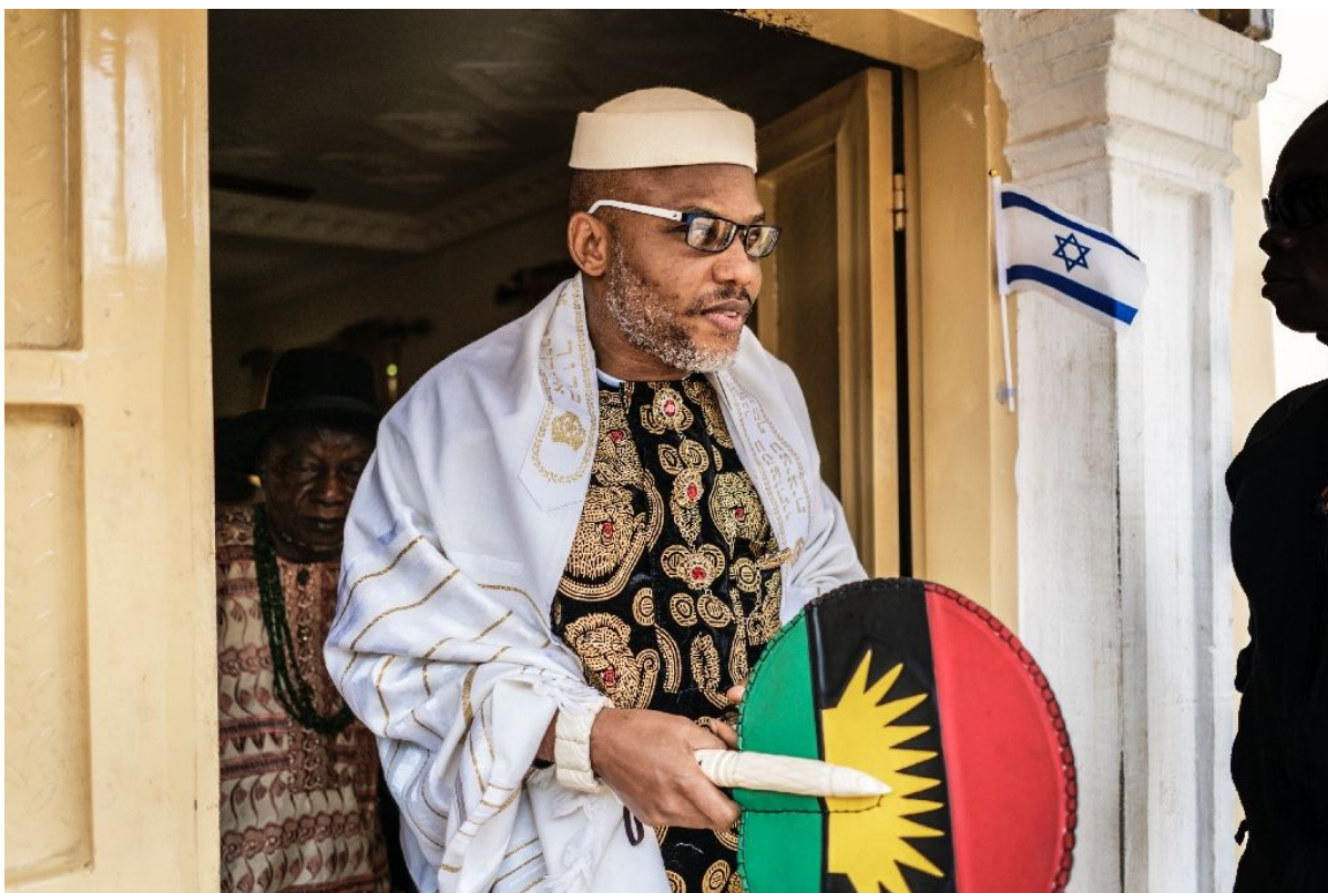
Лидер IPOV Ннамди Кану

Американский еврейский конгресс даже сравнил положение игбо с прошлыми гонениями на евреев, израильский Красный Крест поставлял им продукты и предметы первой необходимости, а правительство Израиля снабжало оружием.