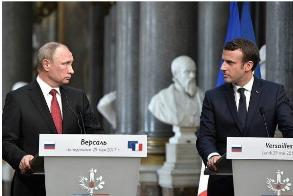
Встреча Эмманюэля Макрона с Владимиром Путиным

поддерживать отношения. В конце концов, его выбирали французы, и в первую очередь он думает об интересах своей страны.