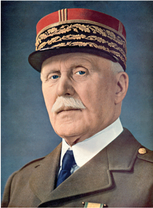
Маршал Филипп Петен