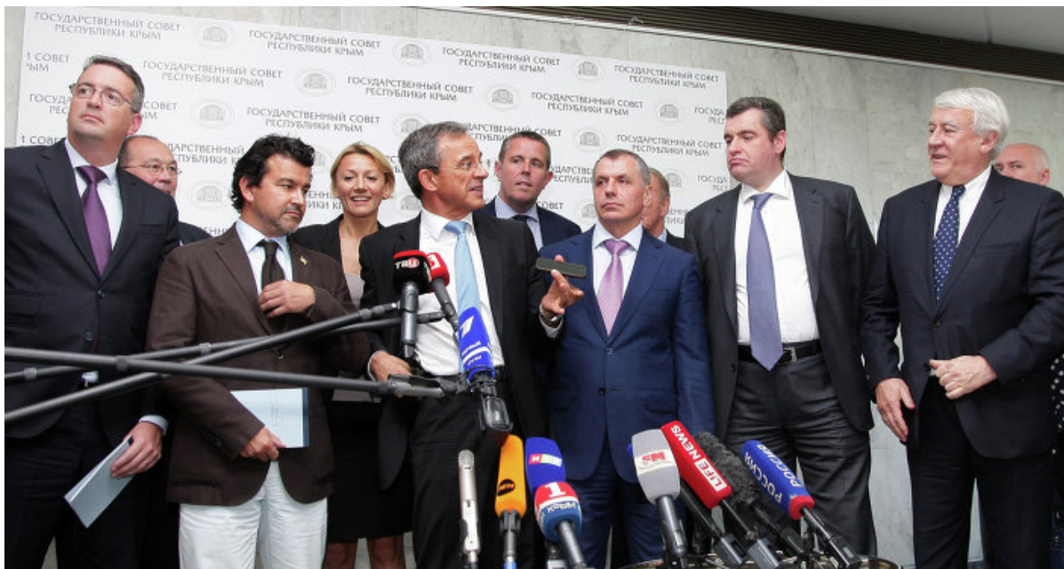
Французские парламентарии в ходе визита в аннексированный Крым