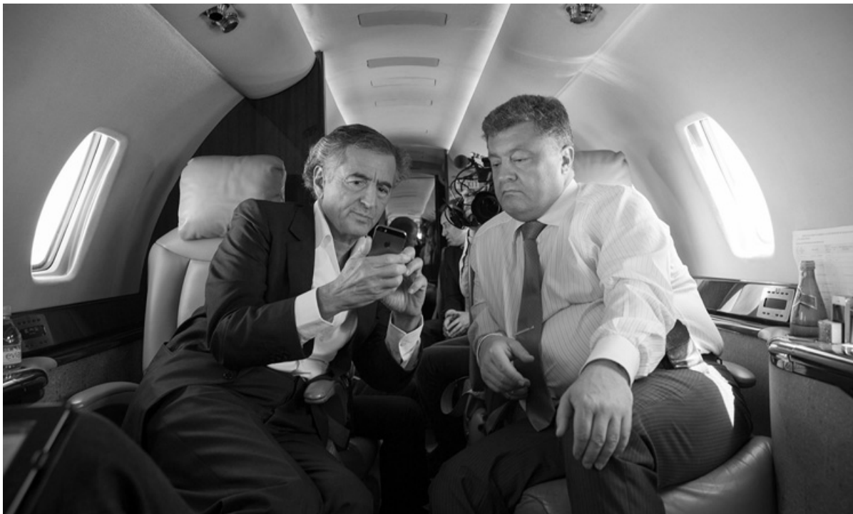
Бернар-Анри Леви в самолете с президентом Порошенко, 2014

Причем, в каждом конкретном случае он прав — я бы могла подписаться под многими из его идей, но из-за порхания от сюжета к сюжету особого доверия в обществе к нему уже нет. Нет и влияния, которым он, Глюксман и другие интеллектуалы, такие как Жан-Поль Сартр или Раймон Арон, обладали лет 40 назад.